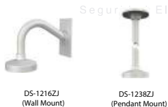
DS-1216ZJ (Wall Mount)